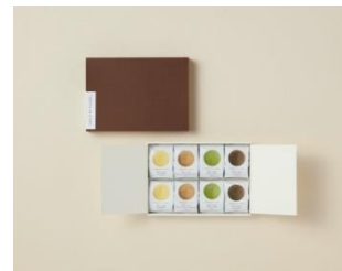
あんケーキ 8入 2,916円