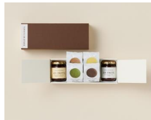
詰合せ D2号 3,672円