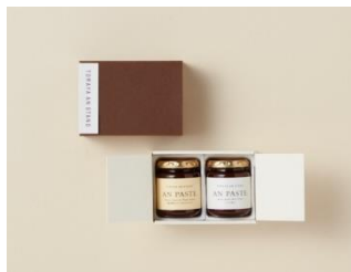
あんペースト 2入 2,160円

あんを思わせる色合いのスリーブ箱。お菓子が引き立つよう、シンプルなデザインに仕上げました。環境、資源に配慮し、箱の素材には古紙を使用しています。