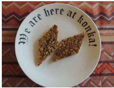
西アジア・ジョージアの家庭で正月に作られる郷土菓子「ゴズィナキ」。クルミをハチミツで炊いて固め、ひし形にカットする。

また壁面パネルでは、長い歴史の中で、外国の文化の影響を受けながら進化してきた和菓子の歴史をご紹介します。日頃、何気なく食べている和菓子が、今日の姿になるまでの、遠大な物語をお楽しみください。