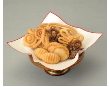
飛鳥～平安時代に遣唐使がもたらしたとされる「唐菓子」